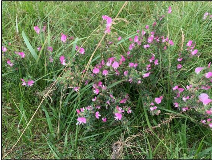
Kruipend stalkruid (Kattendoorn)