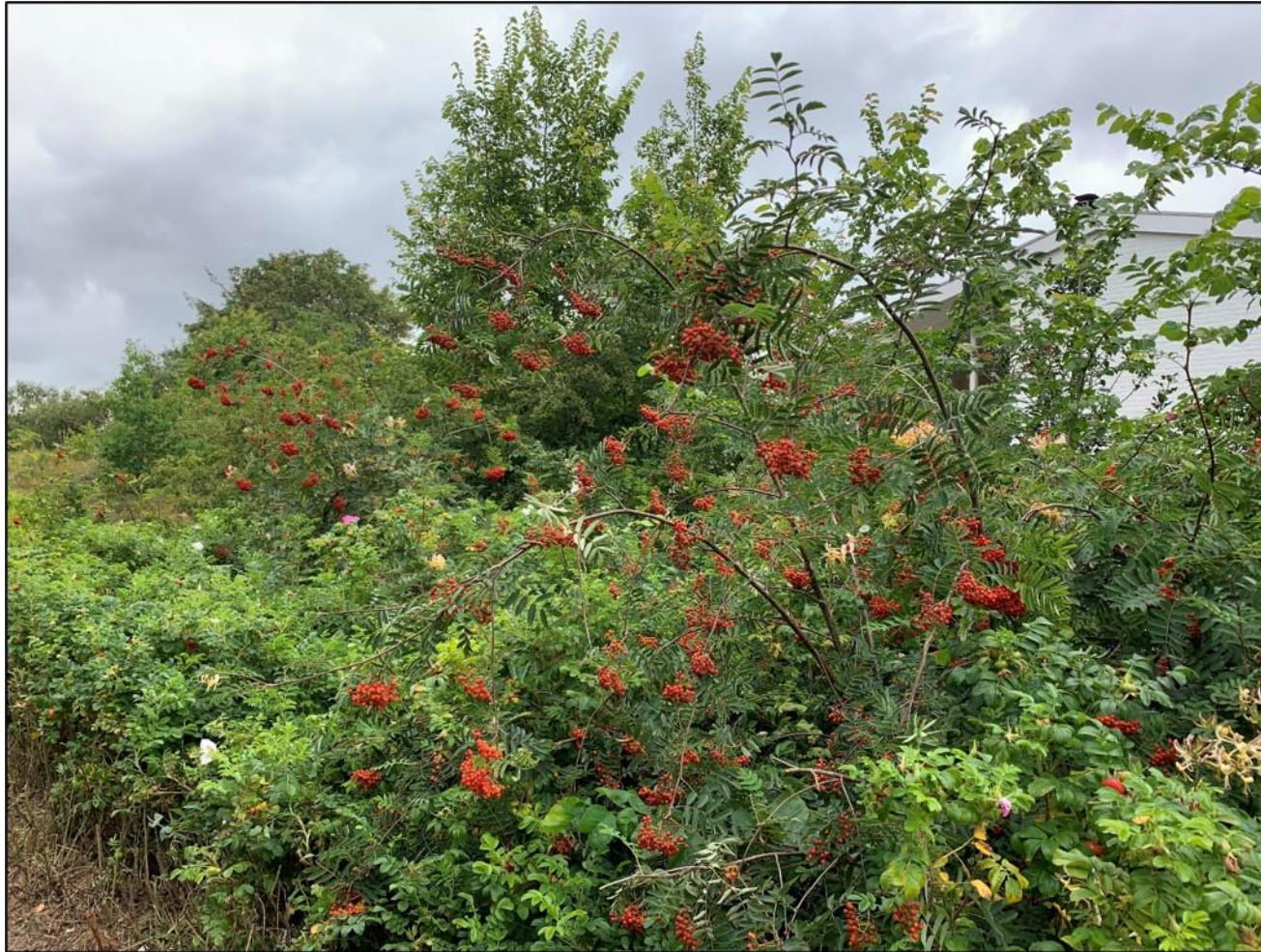
Lijsterbes in de zomer