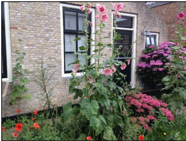
Stokroos Hortensia Klaproos