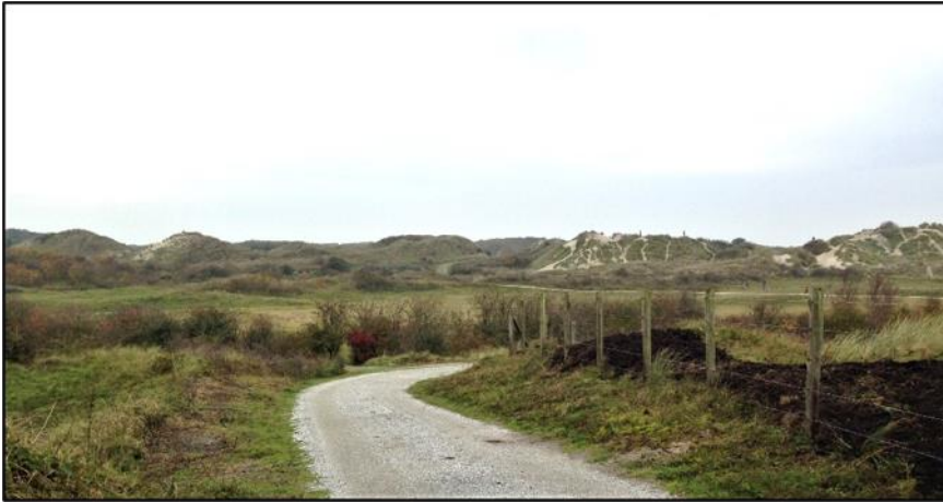
Fiets- en looppaden door de duinen