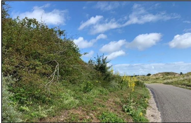
Koningskaars (ook wel "Gele toorts" genoemd)