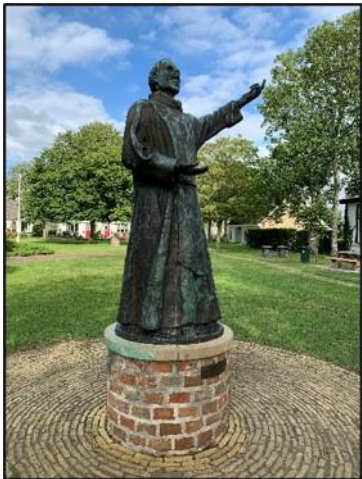
"De Schiere Monnik"

De monniken op de kloosterboerderij droegen grijze pijen Schier = Grijs Oog = Ei in Eiland