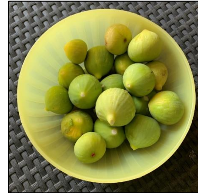
Twee soorten vijgen