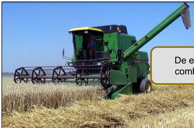
De eerste combines