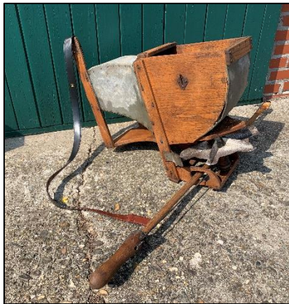
Zaaiiool voor kleine zaden als gras- en klaverzaad