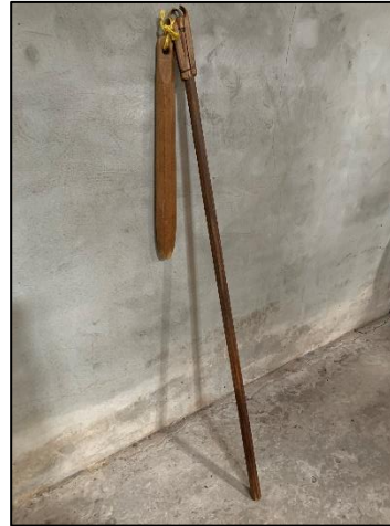
Vlegel voor dorsen graan