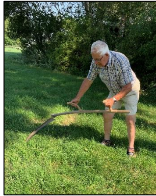
Maaien met de zeis