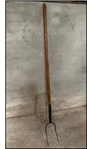
Hooivork (Gaffel heeft drie tanden)