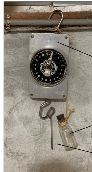
Unster voor wegen melk