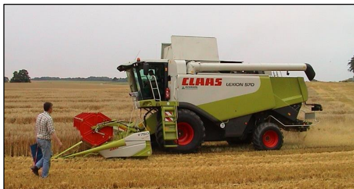
Van afzonderlijke dorsmachine naar de moderne combine