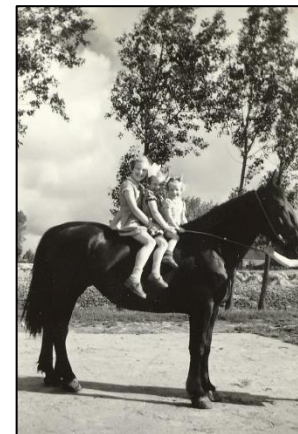
Het paard als rijdier

De rijen links zijn blijkbaar al eerder gezaaid (zie groene rijen).