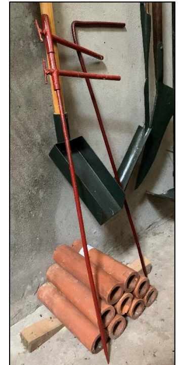
Hulpmiddelen voor aanleg drainage Voor graven sleuven en juiste helling