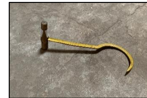
Haak voor hooi en stro