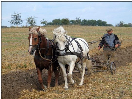
Van trekdier naar trekker