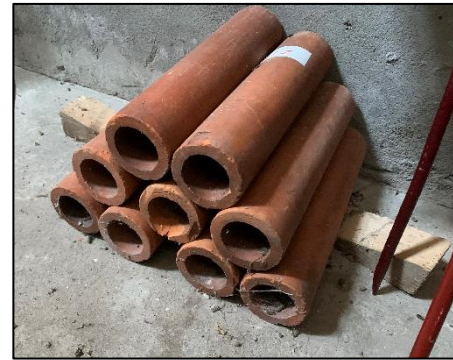
Keramische drainagebuizen (soms met kraag) Voor verlagen grondwaterstand