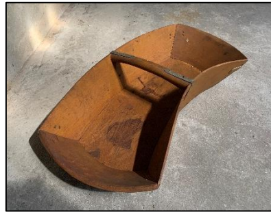
Zaibak voor graan en kunstmest