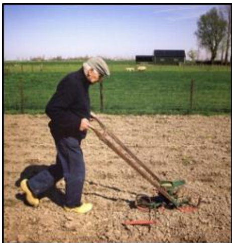
Bieten- en bonenzaaier

Deze handgeduwde eenrijige zaaimachine werd veel gebruikt op kleine perceeltjes voor het zaaien van bieten en bonen. Velen hadden een grote tuin bij hun huis en gebruikten dan deze handige machine.