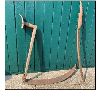
Zicht met welhaak / pikhaak