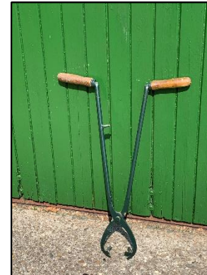
Tang voor rooien suikerbieten