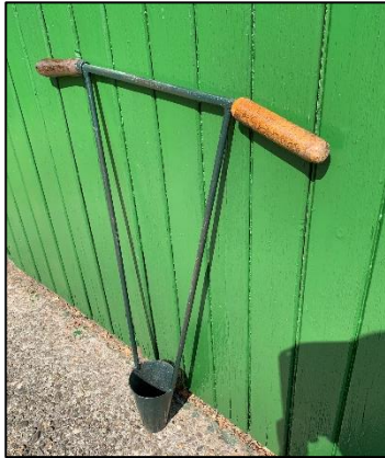
Pootstok om gat te maken voor aardappel