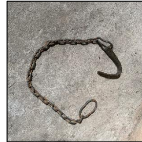
Spanketting voor rustig houden koe