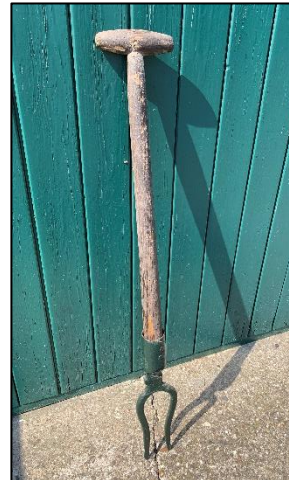
Vork voor rooien bieten