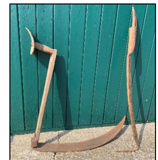
Zicht en welhaak