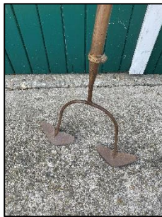
Dubbelloop padschoffel voor twee rijen tegelijk