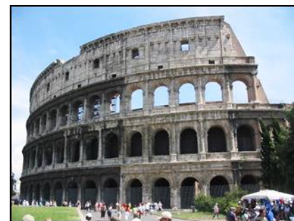
Colosseum in Rome