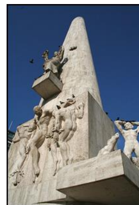
Nationaal Monument Amsterdam