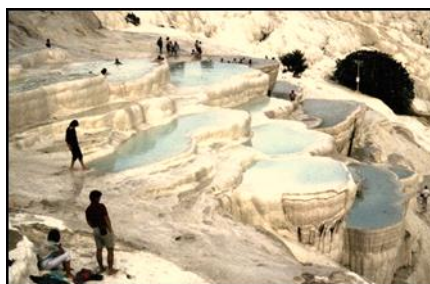
Pamukkale in Turkije